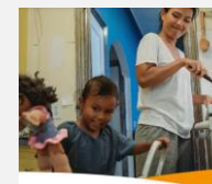
A snapshot of social protection measures for undocumented migrants by national and local governments

Italia: elección del activista italo-marfileño Aboubakar Soumahoro a la Cámara de Diputados, quien se dedicó a la lucha por los trabajadores migrantes y temporeros en el sector agrícola.