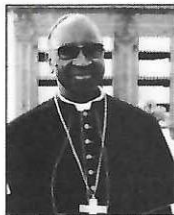
Théodore Adrien Cardinal SARR