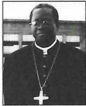
Mgr Benjamin NDIAYE