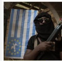
WITH OR AGAINST US PEOPLE OF THE NORTH-WEST REGION OF CAMEROON CAUGHT BETWEEN THE ARMY, ARMED SEPARATISTS AND MILITIAS

RDC: nuevo atentado en Kivu Norte (este del país), en el que mueren al menos 8 civiles. Se sospecha que el M23 está detrás.