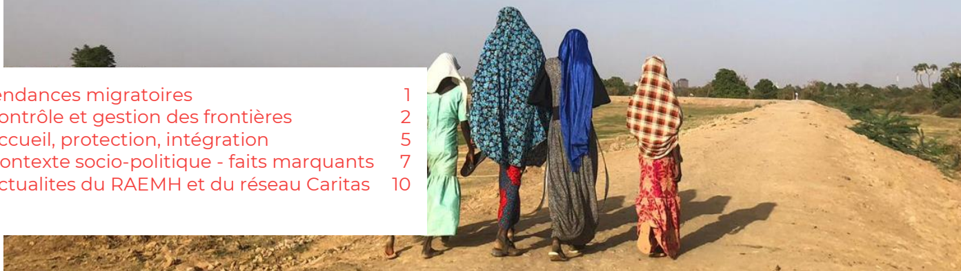
Les fils d'actualité mensuels du RAEMH recueillent une sélection d'informations sur certaines régions et thématiques d'intérêt pour les membres du réseau. Ils n'ont pas vocation à refléter de manière exhaustive l'actualité sur les mobilités internationales.