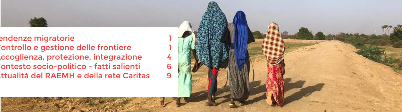
I feed di attualità mensili del RAEMH raccolgono una selezione di informazioni su alcune regioni e tematiche di interesse per i membri della rete. Non hanno lo scopo di riflettere in modo esaustivo l'attualità sulla mobilità internazionale.