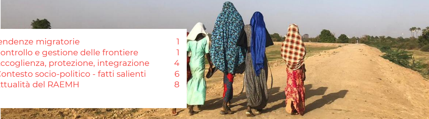
I feed di attualità mensili del RAEMH raccolgono una selezione di informazioni su alcune regioni e tematiche di interesse per i membri della rete. Non hanno lo scopo di riflettere in modo esaustivo l'attualità sulla mobilità internazionale.